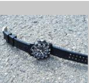
▲ Im freien Fall: Die Mondaine Watch hat alles schadlos überstanden.